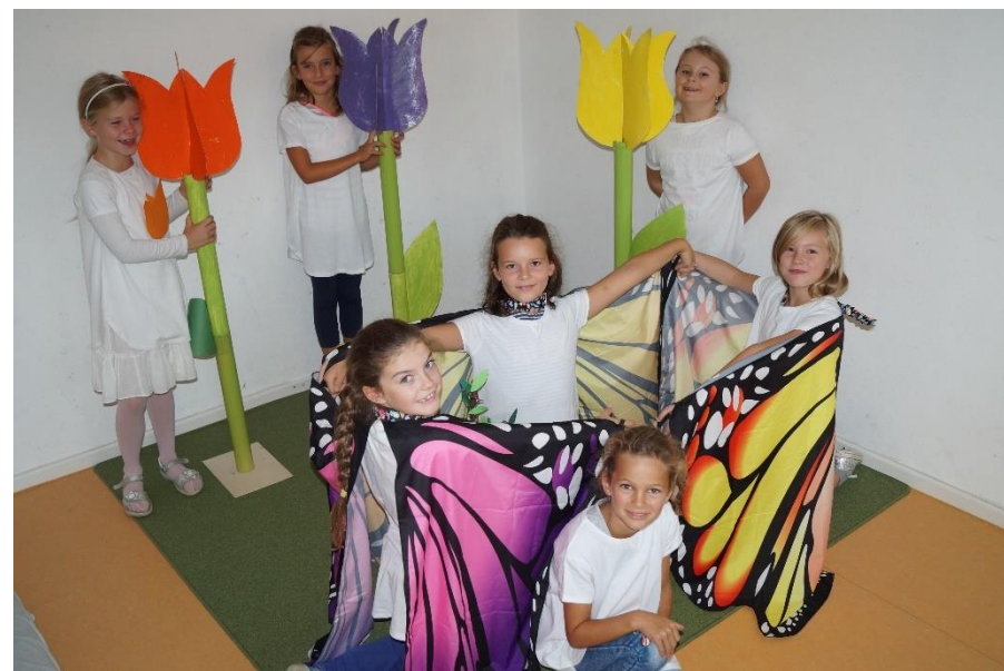
Die Mitwirkenden der Theater-AG

Wer Interesse an der Theater-AG hat, meldet sich bitte bei Edholzer Kerstin in der Fliegenpilzgruppe der offenen Ganztagsbetreuung.